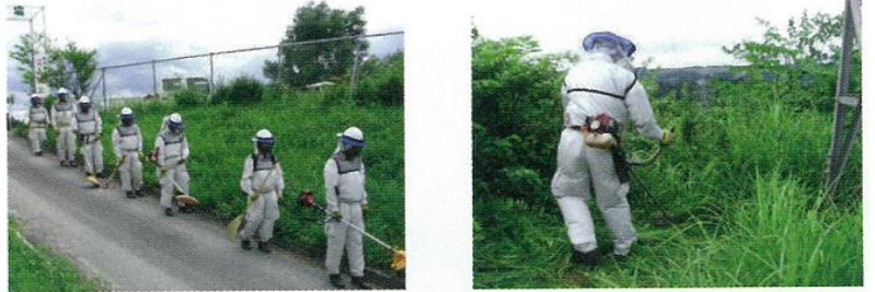
送電線保守作業の様子

注)この防蜂用空調服は蜂に刺されにくいように、さまざまな工夫を取り入れておりますが、効果は絶対的なものではありません。蜂に対しては充分ご注意くださいのうえご使用ください。